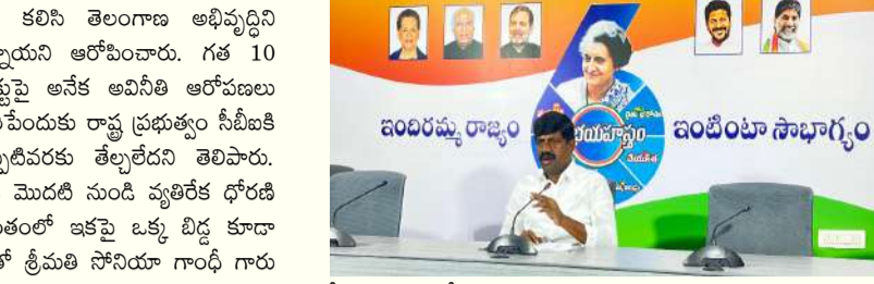
బీఆర్ఎస్ రాజకీయం ఆట ఉందని ప్రజలు భావిస్తున్నారని అన్నారు. రాహుల్ గాంధీగారిని ప్రధాన మంత్రిని చేసే ఛక్రం