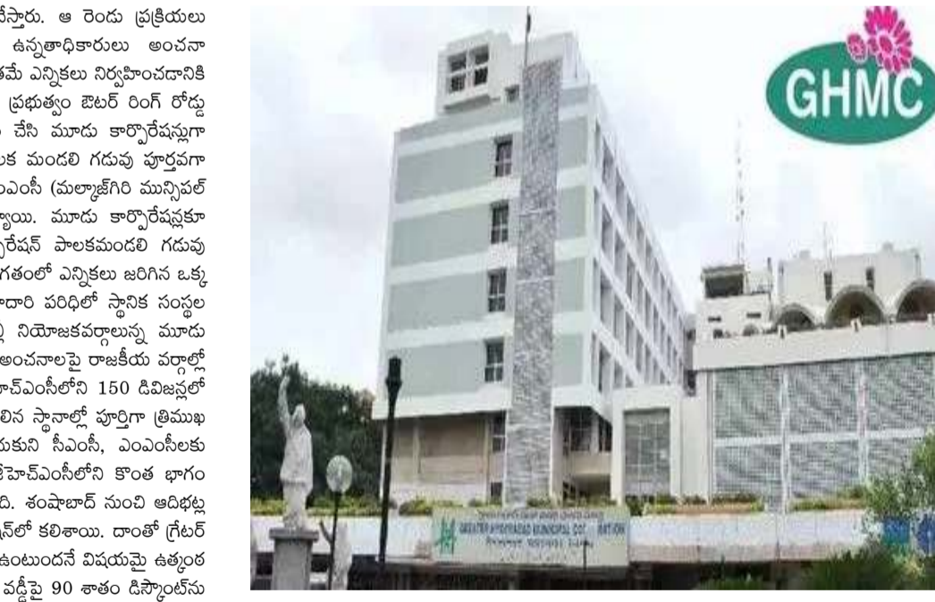
ప్రాచీన బ్యూజ్ వసూలైట్లు. అలాగే నైబరాబాద్ మున్సిపల్ కార్పొరేషన్ పరిధిలో 9 లక్షల 43 వేల 432 భవనాలందగా రూ. 916 కోట్లు ఆదాయం సమకూరింది. మల్లాజేగిరి కార్పొరేషన్‌లో 7 లక్షల 91 వేల 507 నిర్మాణాలకు రూ. 502 కోట్ల ఆన్లైన్ పన్ను వసూలైట్లు బియ్యం తెలిపింది.