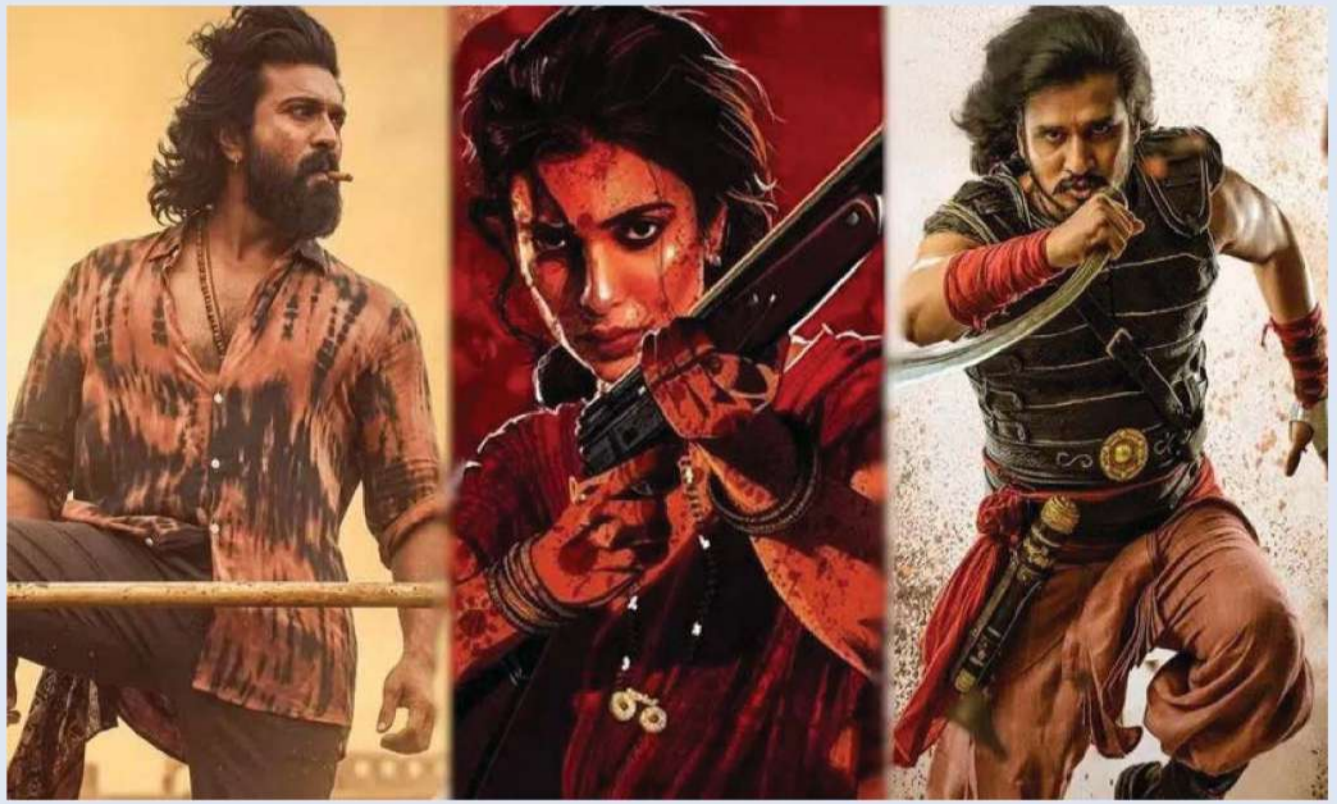
సిద్ధమవుతున్నాయి. ఇక వీటిలో ఏ సినిమా బాక్సాఫీస్ వద్ద సంచలనం సృష్టిస్తుందో చూడాలి.

ఒకేసారి నాలుగు సినిమాలు థియేటర్లలోకి రాబోతున్నాయి. 'బాలన్ ది బాయ్', 'ట్రాన్స్ ఫర్ త్రిమూర్తులు', హీరో కామెడీ మూవీ 'చెట్టు మీద దెయ్యం నాకేం భయం', అలాగే ఫ్యామిలీ ఎమోషన్స్ తో తెరకెక్కిన 'మా ఇంటి బంగారం' సినిమాలు ఒకేరోజు విడుదల కానున్నాయి. ఈ నాలుగు చిత్రాలు పూర్తిగా భిన్నమైన జోనర్లలో ఉండటంతో ప్రేక్షకులకు మంచి ఎంటర్టైన్మెంట్ ప్యాకేజీ లభించే అవకాశం ఉంది. ముఖ్యంగా హీరో కామెడీ సినిమాలకు ఇటీవల మంచి ఆదరణ లభిస్తున్న నేపథ్యంలో 'చెట్టు మీద దెయ్యం నాకేం భయం'పై ప్రత్యేక ఆసక్తి కనిపిస్తోంది. జూన్ చివరి వారం మాత్రం బాక్సాఫీస్ వద్ద భారీ హంగామా ఉండనుంది. జూన్ 26న పీరియడిక్ యాక్షన్ డ్రామా 'స్వయంభూ' విడుదల కానుంది. ఈ సినిమాపై ఇప్పటికే సినీ వర్గాల్లో మంచి బజ్ నెలకొంది. అదే రోజున స్పోర్ట్స్ డ్రామా 'సూపర్ గోల్' కూడా ప్రేక్షకుల ముందుకు రానుంది. ఇక రాజకీయ నేపథ్యంతో తెరకెక్కిన ఇంటిన్స్ డ్రామా 'లెనిన్' కూడా జూన్ 26నే విడుదల కానుండటం విశేషం. దీంతో నెలాఖరులో మూడు ప్రధాన చిత్రాలు ఒకేసారి బాక్సాఫీస్ బరిలోకి దిగనున్నాయి. మొత్తం మీద చూస్తే 2026 జూన్ నెల టాలీవుడ్ ప్రేక్షకులకు పుల్ ఎంటర్టైన్మెంట్ ఇవ్వబోతోందనే చెప్పాలి. భారీ పాన్ ఇండియా సినిమా నుంచి చిన్న కాన్సెప్ట్ మూవీ వరకు అన్ని రకాల చిత్రాలు ప్రేక్షకులను అలరించేందుకు